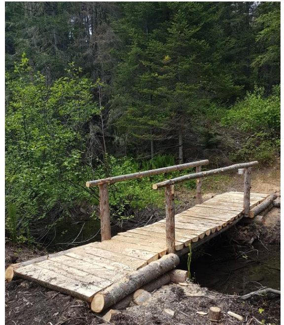
Photos : Chalet et pont piéton construits pour la Société de gestion des rivières de Gaspé.